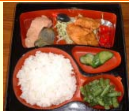
総合支庁で販売した地産地消弁当です。