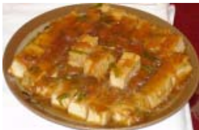
↑ まるい食品さん提供の厚揚げのいろどりあん