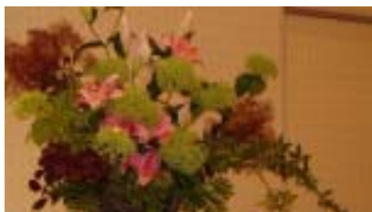
↑ サポーター交流会2周年記念イベント～旬まるかじり弁当を創ろう～を行い、今回は104人の方々から参加していただきました。