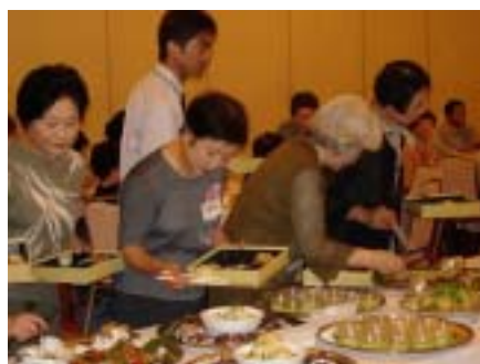
↑ 旬まるかじり弁当製作中みなさんどれを詰めようか考えています