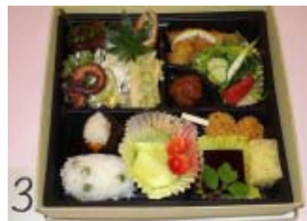
↑ 旬まるかじり弁当完成