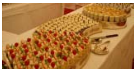
↑ 第一ホテル鶴岡提供のケーキ