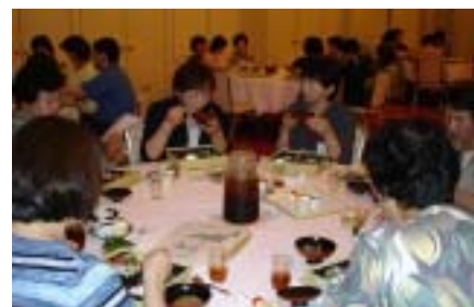
↑ おいしそうに食べています